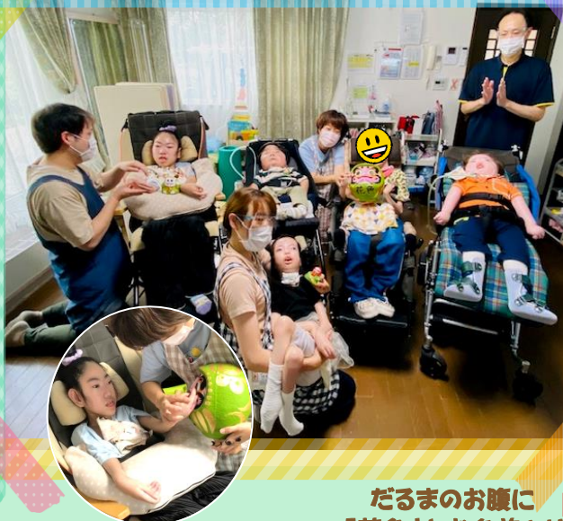
だるまのお腹に 「花色」とお名前入り