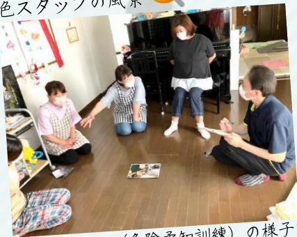
7月16日 KYT (危険予知訓練) の様子です。