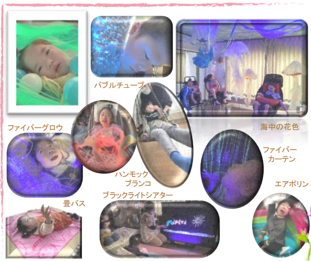
<花色のスヌーズレン>

※利用料金は、お手持ちの福祉サービス受給者証の負担上限額迄になります。(所得により：0円、4,600円、* 1 37,200円/すべて月額) * 2 概ね収入が890万円を超える世帯